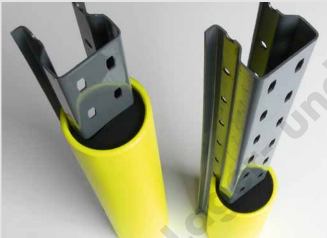
Sicherer Halt an den Regalständern.