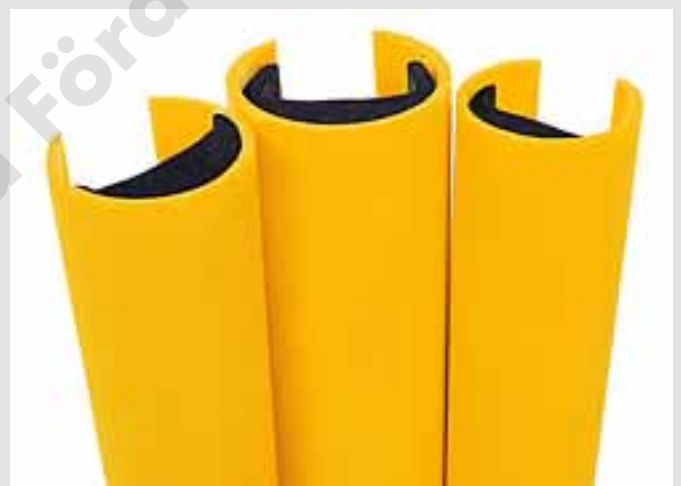
In verschiedenen Größen erhältlich.