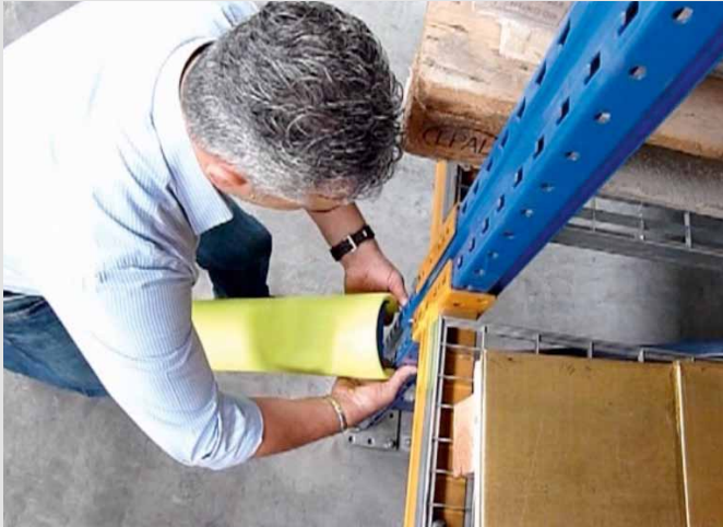
Montage ohne Werkzeug!