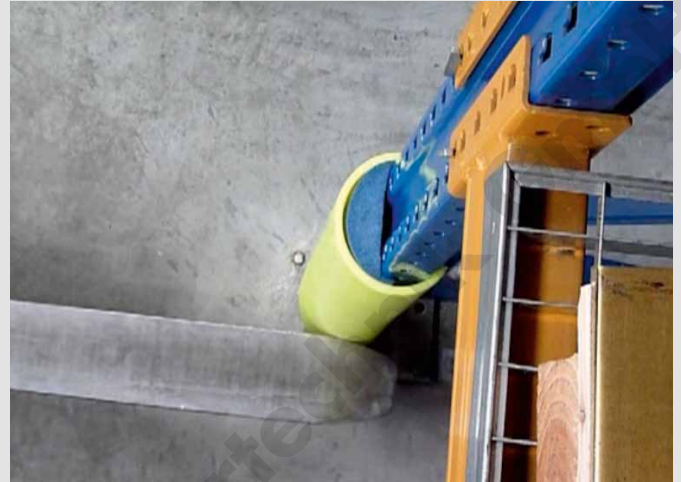
Staplergabeln werden vom Regalständer abgelenkt.