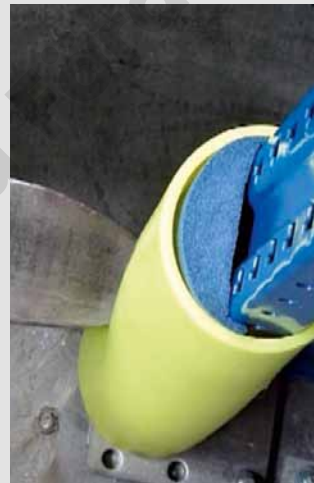
Springt nach dem Aufprall in seine Form zurück.