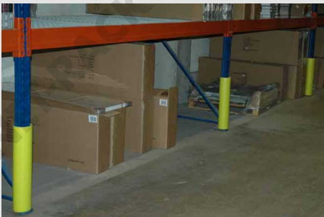
Für fast alle Regale geeignet, sogar in Tiefkühlhallen.