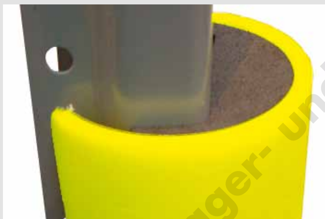
Sehr langlebig da aus hochwertigem Polyethylen.